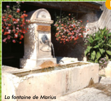
La fontaine de Marius