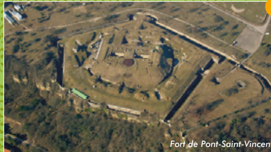
Fort de Pont-Saint-Vincent

Sainte Barbe est la patronne des mineurs, mais aussi des artisans, des pompiers, des artilleurs (Fête le 04 décembre).