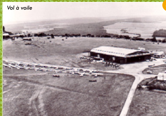
Vol à voile