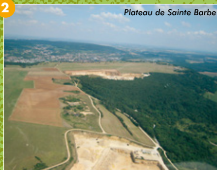
Plateau de Sainte Barbe